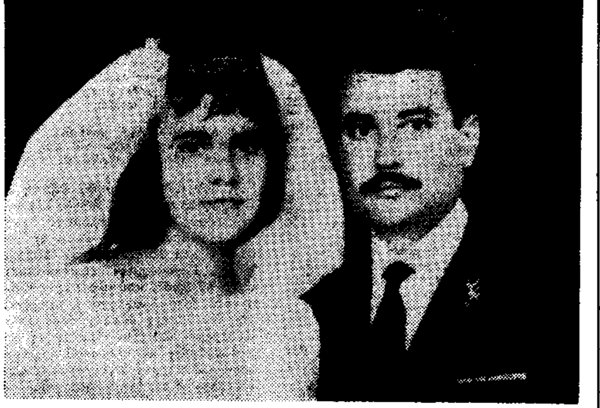
Τό ζώντο Διπλωμάτη στήν άστυρητική φωτογραφία του γάμου τους.