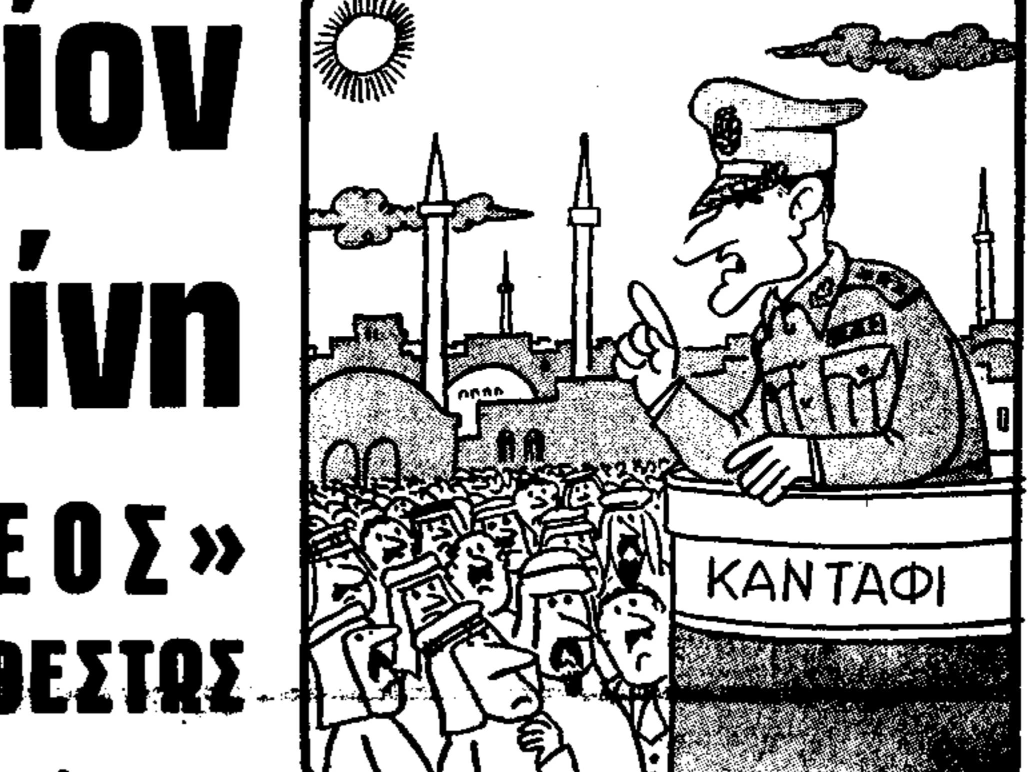
Βοηθήστε με, γιατί άν άποτύχω θάρρη...